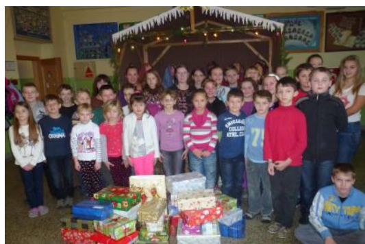
Sok-sok gyermeknek szeretnénk örömet szerezni az összegyűjtött ajándékokkal!